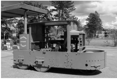
Verdens første 3-valsede tromle