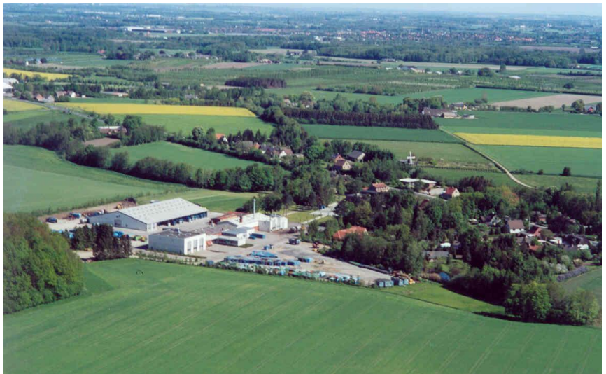
Marius Pedersen. Billede fra omkring 2000